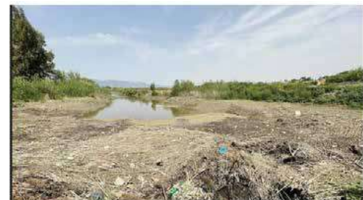
Nehrin kuruması ile ortaya çıkan kirlilik çevrecilerin tepkisine neden oluyor.