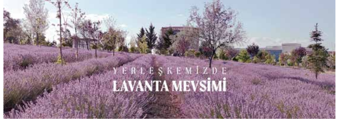
YERLEŞKEMİZDE LAVANTA MEVSİMİ