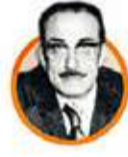
Prof. Dr. TURAN GÜNEŞ TC Dışişleri Bakanı