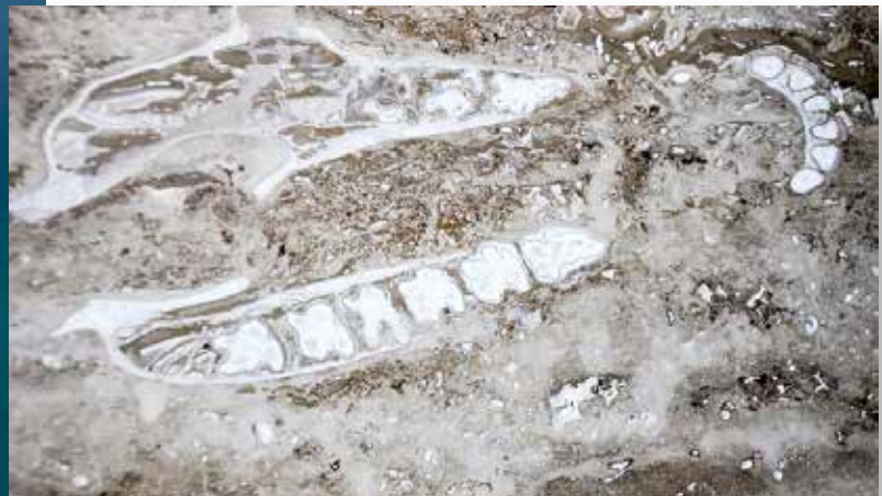
Denizli'de ortaya çıkarılan fosillerden biri