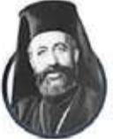
MAKARIOS Kıbrıs Cumhurbaşkanı