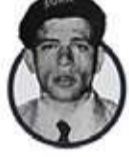
NIKOS SAMPSON EOKA-B liderlerinden