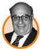
RAUF DENKTAŞ KKTC Cumhurbaşkanı