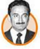
BÜLENT ECEVİT TC Başbakanı