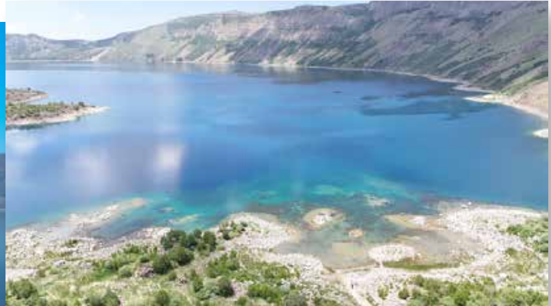
Nemrut Kalderası üzerinde bir göl bulunuyor