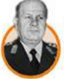
Orgeneral SEMİH SANCAR TC Genelkurmay Başkanı