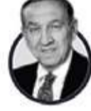
JOSEPH SISCO ABD Dışişleri Bakanı Yardımcısı