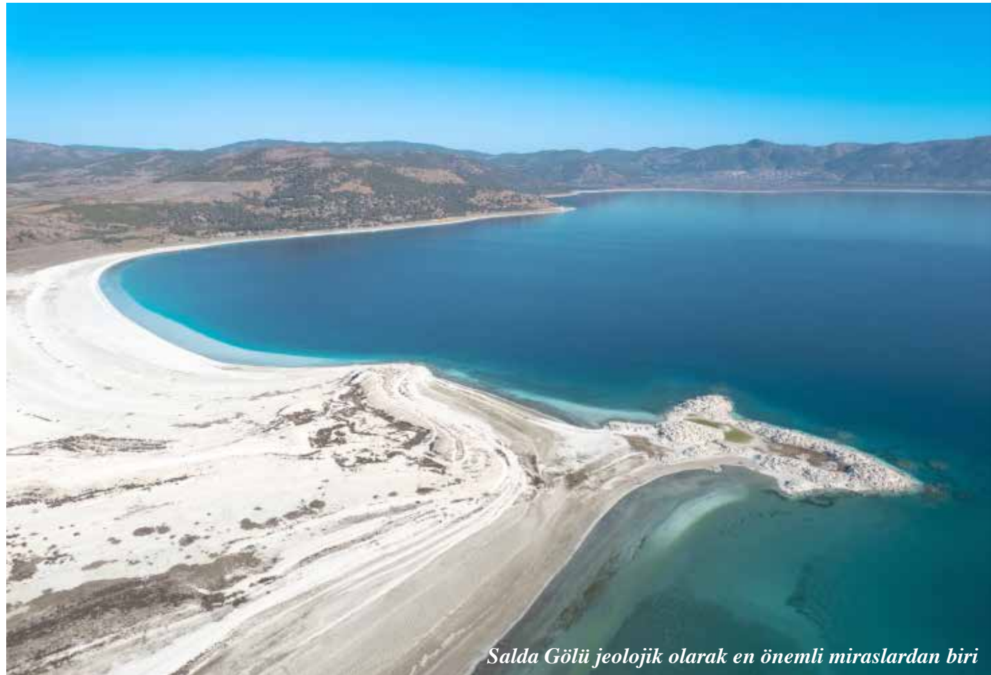
Salda Gölü jeolojik olarak en önemli miraslardan biri