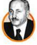
NECMETTİN ERBAKAN Başbakan Yardımcısı