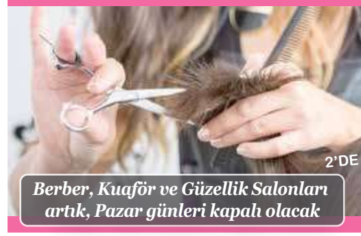
Berber, Kuaför ve Güzellik Salonları artık, Pazar günleri kapalı olacak