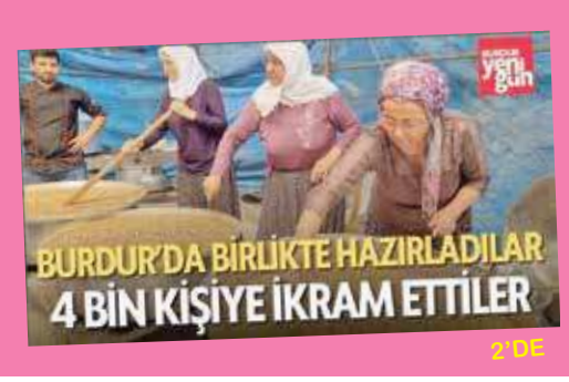
BURDUR'DA BİRLİKTE HAZIRLADILAR 4 BİN KİŞİYE İKRAM ETTİLER