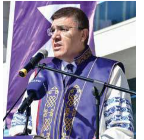
Rektör Hüseyin Dalgar

Burdur Yörük Kültürü Araştırma ve Yaşatma Derneği (YÖRKAYDER), festival alanında kurdukları Yörük çadırıyla Teke Yöresi'nin zengin kültürünü tanıttı.