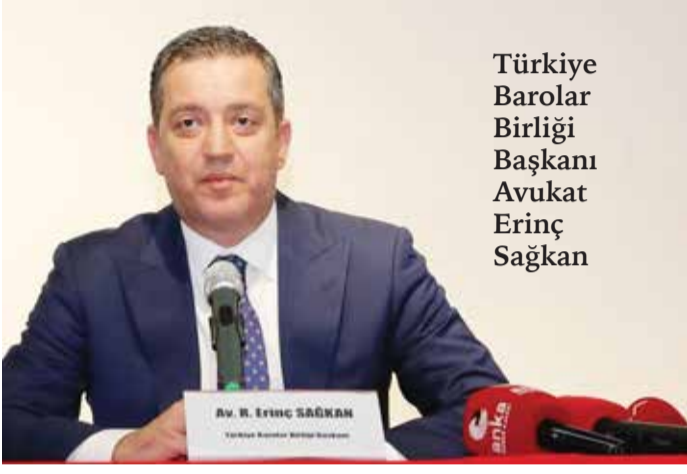
Türkiye Barolar Birliği Başkanı Avukat Erinç Sağkan

Türkiye Barolar Birliği Başkanı (TBB) Sağkan Burdur’da konuştu: “Temel hak ve özgürlüklerin ihlal edildiği bir ortamda yeni bir anayasa tartışması açmak yurttaş nezdinde sağlıklı bir karşılık bulmayacaktır”