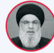
Hizbullah lideri Hasan Nasrallah

İsrail ordusu 8 Ekim 2023'ten bu yana Hizbullah lideri Hasan Nasrallah ve üst düzey komutanlarını hedef aldı