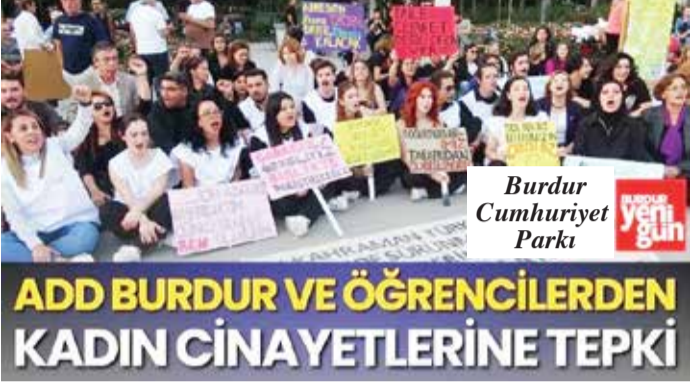
Burdur'da Atatürkçü Düşünce Derneği (ADD) üyeleri ve öğrenciler, kadın cinayetlerine tepki gösterdi.

Önceki gün Grup adına yapılan açıklamada, "İki genç kadının hunharca cinayete kurban gitmesi ve adını bile bilemediğimiz, çoğu zaman duymadığımız onlarca kadının canice katledilmesi, yüreklerimizi derinden yaraladı. Bu kayıplar, toplum olarak içimizde kapanması imkânsız yaralar açtı.