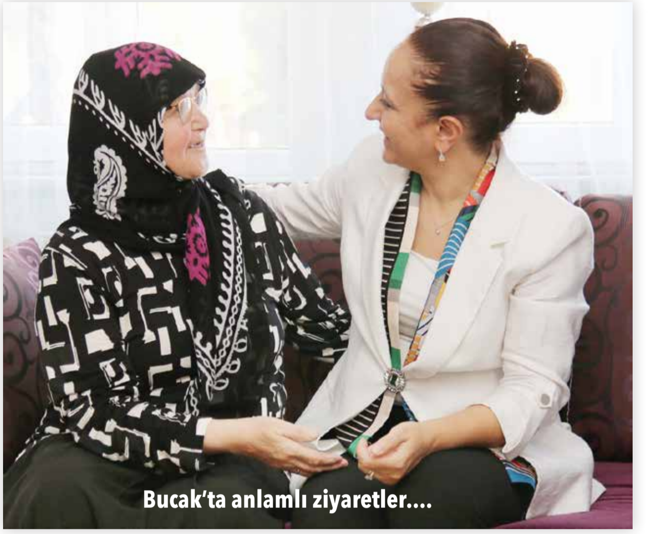
Bucak'ta anlamlı ziyaretler....