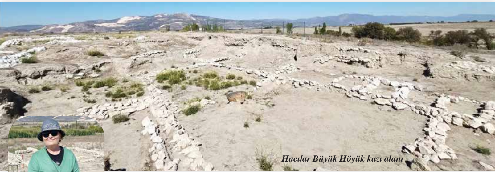
Hacilar Büyük Höyük kazı alanı