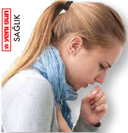
Akciğerin sinsi düşmanı: BRONŞEKTAZİ 3'TE

Burdur Belediyesi ve Tüm Emekliler Derneği iş birliğiyle hizmete giren Emekli Kafe ve Berber Salonu'nun açılışına katılan Çalışkan, emeklilerin ekonomik zorluklarını ve hak taleplerini gündeme taşıdı. "Emeklilik bize lütufla gelmedi, hakkımızdır. Bugün hakkımızı istiyoruz" diyen Çalışkan, emeklilik sistemindeki adaletsizliklere vurgu yaptı ve intibak yasasının acilen çıkarılması gerektiğini belirtti. 7'DE