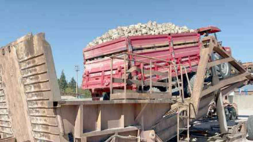
Burdur Şeker Fabrikası'nda 2024-2025 kampanya dönemi sona erdi.

Burdur Şeker Fabrikası'nda 25 Eylül'de başlayan ve 110 gün süren 2024-2025 kampanya dönemi sona erdi. 70'inci kampanya döneminde işlenen 576 bin ton pancardan 72 bin 185 ton şeker, 26 bin 650 ton melas, 165 bin ton yaş küspe üretildi.