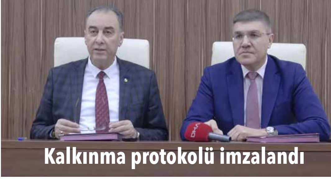
Kalkınma protokolü imzalandı