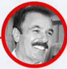
Ferdi TAYFUR 2 Ocak 2025 (Dogum: 1945)