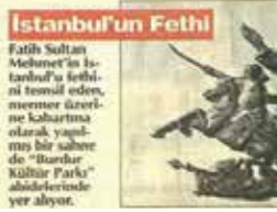
Fatih Sultan Mehmet'in İstanbul'u fethini temsil eden, mermer kareye kabartma olarak yapılmış bir sahne de "Burdur Kültür Parkı" abidelerinde yer alıyor.