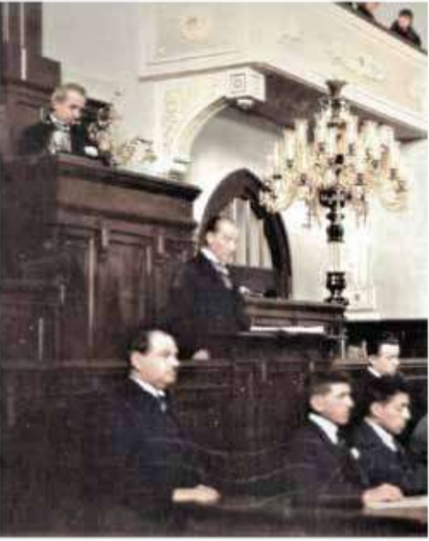
Tarihçi-yazar Sinan Meydan, Cumhuriyet'te yayımlanan yazısında, Nutuk'un yalnızca bir tarih anlatısı değil, Cumhuriyet'in temel belgesi olduğunu vurguluyor.