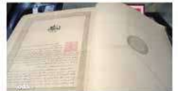
Nutuk'un sadece yazılı bir belge değil, öncelikle bir konuşma olduğunu altını çizen Meydan "Atatürk, önce kulaklara seslendiği için bu tarihi konuşmaya Nutuk denmiştir. Okuma yazma oranının yüzde 10 olduğu bir ülkede, sözünün gücüyle millete ulaşmıştır." diyor.

"İşte; bu ahval ve şerait içinde dahi vazifen Türk istiklal ve Cumhuriyetini kurtarmaktır..."