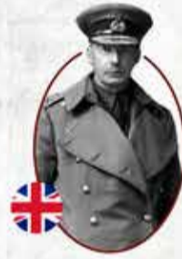
General Charles Townshend

I. Dünya Savaşı'nda Osmanlı'nın Çanakkale'den sonra kazandığı en büyük ikinci zafer