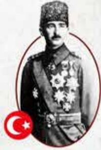
Mirliva Halil Kut Paşa

I. Dünya Savaşı'nın temel muharebelerinden biri olan Kut'ül Amare Kuşatması, 29 Nisan 1916'da Irak Cephesinde Osmanlı'nın galibiyetiyle sonuçlandı