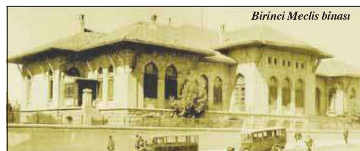
Birinci Meclis binası

Mustafa Kemal Atatürk önceden beri Meclis-i Mebusân'ın İstanbul'da değil, Anadolu'da toplanmasını istemektedir.