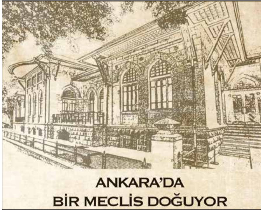
ANKARA'DA BİR MECLİS DOĞUYOR

Heyet-i Temsiliye'nin başkanı olan Atatürk, kendisinin Meclis-i Mebusan'ın başkanı seçilmesini ve Anadolu'da süren hareketin yasal olarak tanınmasını istiyordu.