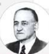
Mehmet Emin Resulzade Azerbaycan'ın kurucusu

"Bir kere yükselen bayrak bir daha inmez"