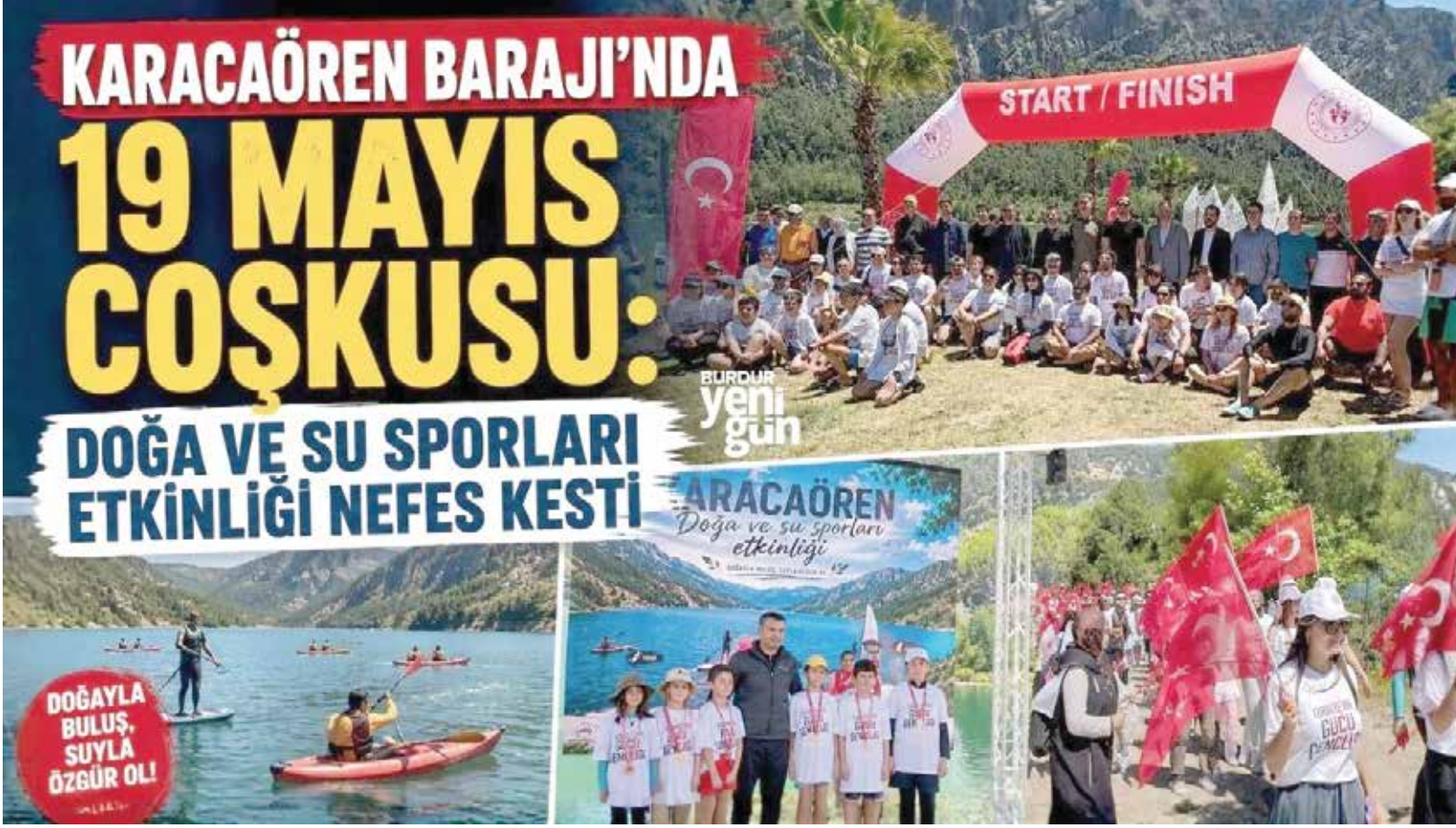
Karacaören Barajı'nda düzenlenen etkinlikler, renkli görüntülere sahne oldu...